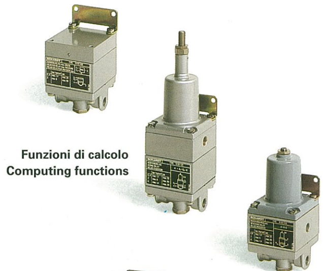
Funzioni di calcolo Computing functions

Lock-in Relay limit Relay changeover Relay pulse generator