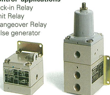
Limitazione di segnale Signal limiting